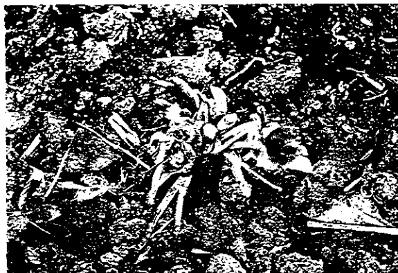
▲山芹菜自莖端葉梗處摘除，可持續採收三~四次。

播種後約65~80天，株高約20~30公分時即可採收，採收時可以全株採收，或者於葉梗及葉片未枯萎，花苔未抽出前，葉片青翠時，自莖端葉梗處摘除，播種一次可持續採收三至四次。若為自行留種，可視山芹菜種子成熟脫落10%時採收種子，採收