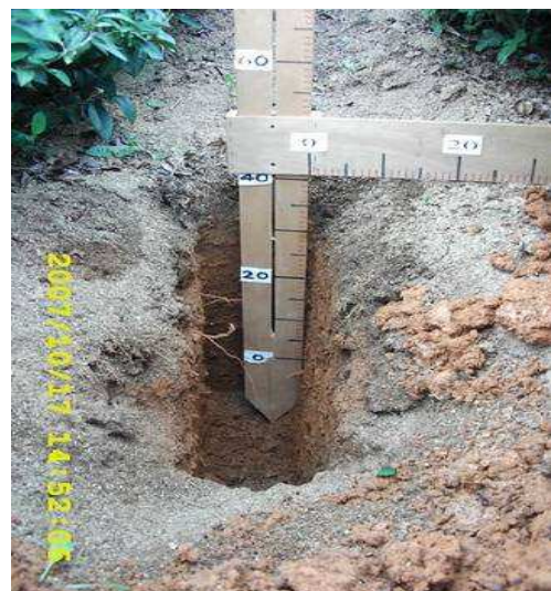
根群嚴重上浮，施再多的肥料(土表厚有機肥卻不翻耕)，也無法改善茶菁生產，最好重新種植