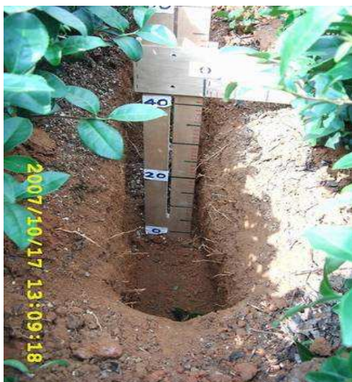
根群均勻分布且深，僅需年底中耕，茶菁產量高，需肥量又少