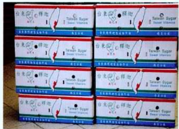
圖11. 本社特有紙箱，上有三色線專屬標誌