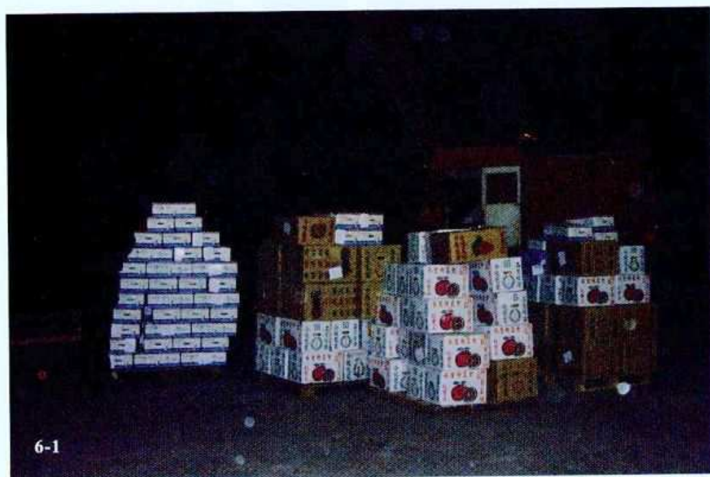
圖6-1-6-2. 經由金門小三通， 2007-1-30傍晚廈門上岸。