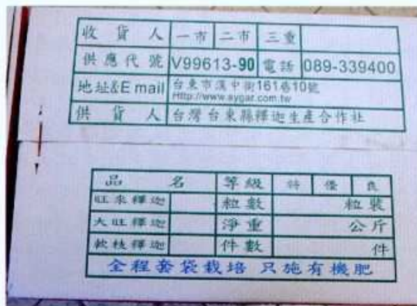
圖10. 箱蓋上標示清楚的聯絡資訊

我品牌也是不可或缺的。以前幾次我們外銷大陸的經驗，堅持使用自己的箱子，當果品流入整個大陸內地廣闊的物流市場後，馬上就有人循著這個箱子找到臺灣找到我們，並且因供貨品質的良好，鞏固了本社品牌形象以及品質的確立，與大陸內地所生產的水果做一個明顯的區隔起來。