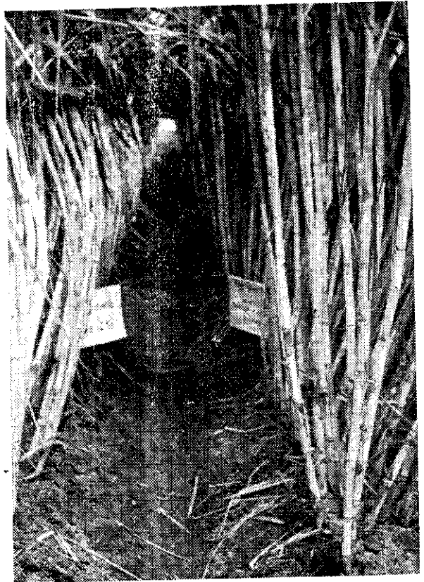
甘蔗施用複合肥料後生長良好情形