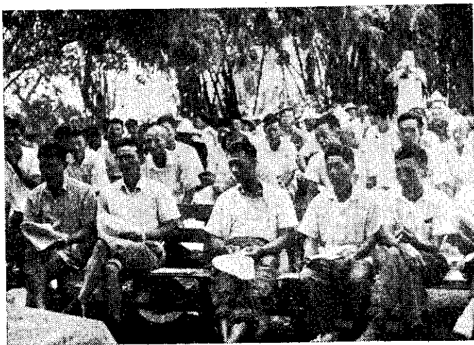
蔗農在觀摩會上聽複合肥料講解

(2) 甘蔗複合肥料是含有三要素的完全肥料，一次施肥可以供給多種養分，減少施肥次數，節省勞力。