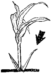
土壤愈肥，分蘖(箭頭所指者)愈多。

除以上所說的幾種害蟲之外，還有大蟋蟀、螻蛄、浮塵子類及葉蟲類，為害大豆幼苗。大蟋蟀在本省早田發生普遍，白天潛伏在地下的巢孔中，夜間出來為害，切斷豆株，搬入孔中。要防治大蟋蟀，最好在播種前撒佈毒餌。毒餌製法：用米糠(也可用甘藷簽或各種蔬菜代替)一公斤，加「嚇必達可樂」(Heptachlor 二五