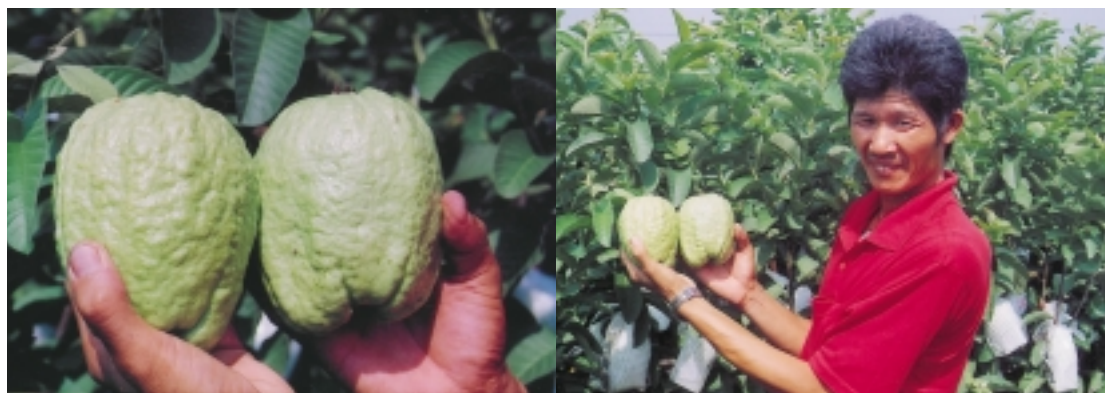
番石榴超級大，每個都在2斤以上