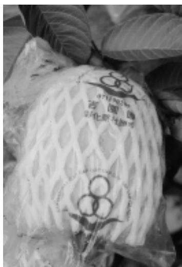
番石榴有吉園圃的認證，讓消費者更有保障

施肥不必挖得太深。一般施肥推薦量以葉片及土壤肥力分析質來推算最為正確，也可以取樣品送有關單位化驗，以達到合理化施肥目的。