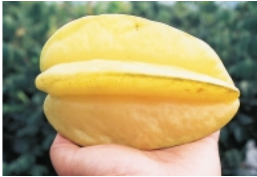
進入採收期的軟枝楊桃—台農1號，色淡黃飽滿

管理以有機質肥料為主，化學肥料酌量以開花前或結果後做為追肥，兩者相互配合施用。有機質肥料種類繁多，正常管理下輪流使用，以防所需元素欠缺。施用時期分春、秋兩季，方法有撒施、溝施、穴施、環施等，施用量依土壤肥瘠而定，每公頃約6,000~12,000公斤。