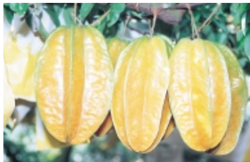
「馬來西亞」種楊桃，金黃有光澤，令人垂涎欲滴

農園」合理化施肥的參考。他說，楊桃成年樹根群逐年老化及土壤表面密實，土粒通氣、保水、保肥性不佳，影響產量與品質。因此每年需中耕1~2次，每次配合有機質肥料的施用，時期為每年的春季（3~4月）及秋季（9~10月），春季可較深，秋季則不可，以防影響樹勢與果粒生長。