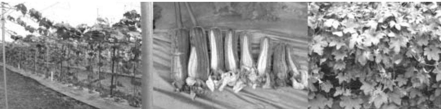
地方品種葉片大、營養生長過於旺盛、晚熟、裂果率高

裂5-6個。果實短筒形，果皮綠色，條紋色澤濃，達食用價值果之縱徑約21公分，橫徑約7.0公分，果重約596公克，硬軟適中，肉質緊密，煮後肉色翠綠。不同期作栽培結果顯示，高雄2號雌花始