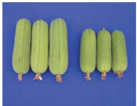
秋綠（左）與對照品種溪州種（右）之果實外觀比較