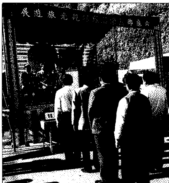
▼ 頒獎給產銷班有功人員