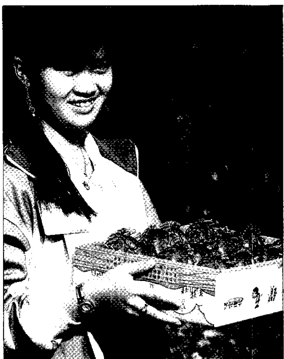
歡迎您來品嚐我們的蓮霧