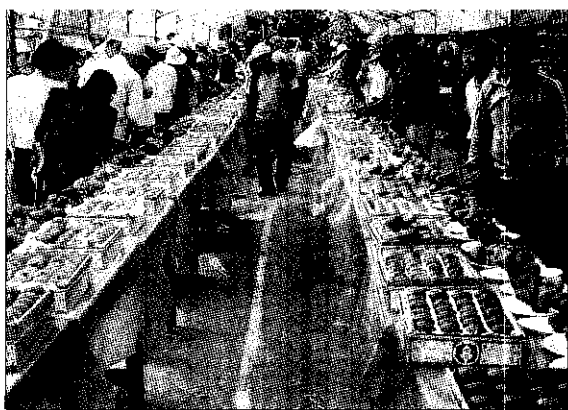
◀ 蓮霧產銷經常舉辦果品競賽