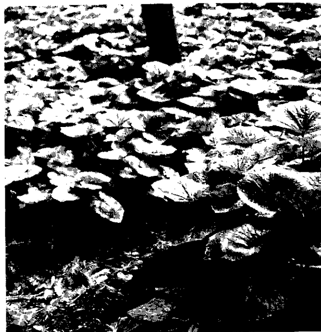
種植於山林蔭處的山葵。