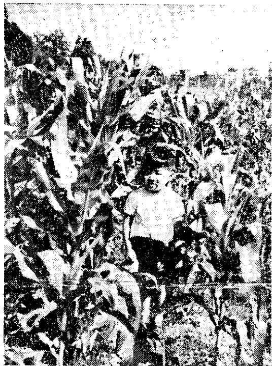
好良育生(右)者蓋敷行未比較(左)米玉的區蓋敷

近年來，本省鳳梨與甘蔗栽培大規模施行PE塑膠布敷蓋，得到豐碩的成果。有鑒於此，筆者等於五十七年春季，應用黑色PE塑膠布敷蓋玉米園土壤，經四個月的時間觀察試驗，發現其具有下列優異的效果。