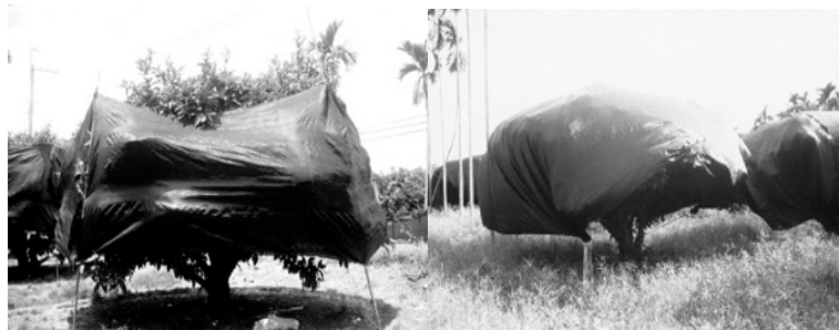
↑ 不同形式遮光方式：包圍樹冠(左)；覆蓋樹冠(右)

臺灣的蓮霧產業發展至今，在加入世界貿易組織之後，雖然沒有進口蓮霧的直接打擊，面對其他進口水果的替代性競爭，大多數的蓮霧果農，對於高成本、高技術的需求，是否能繼續獲得經營的利潤，內心還是存在著不安的感覺。雖然產業的定位，被評估為具有潛力及競爭力，可以積極的去發展，但是不可避免的，產業一些潛在的問題必須先得到解決。當試驗機關及果農不斷地鑽研，使產期提早幾乎可達週年生產的地步；使果實碩大、果皮深紅的品質普遍提升，但國內不少的消費者及消費團體對於食用安全的疑慮並沒有減少，至今仍然存在，影響蓮霧的消費量。希望透過本文介紹目前蓮霧催花的現況，解除消費者的疑慮及幫助栽培者更能精準拿捏催花的技巧。