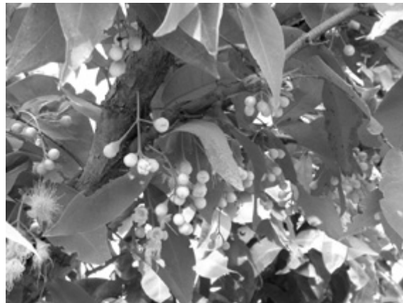
經黑網遮光之後植株開花累累

蓮霧以黑色塑膠網來使產期調節更穩定之後，目前催花前採用遮光處理的面積在六千公頃以上，但產區仍然有很多果農不明瞭黑網在蓮霧生產上所扮演的角色，因此在應用上經常無法拿捏得宜，輕則無法達成預期的催花效果，重則使樹勢受損而影響到果實品質及耐寒力，因此開始思考如何有效的應用遮光及兼顧催花後品質，茲將遮光處理的相關細節敘述如下：