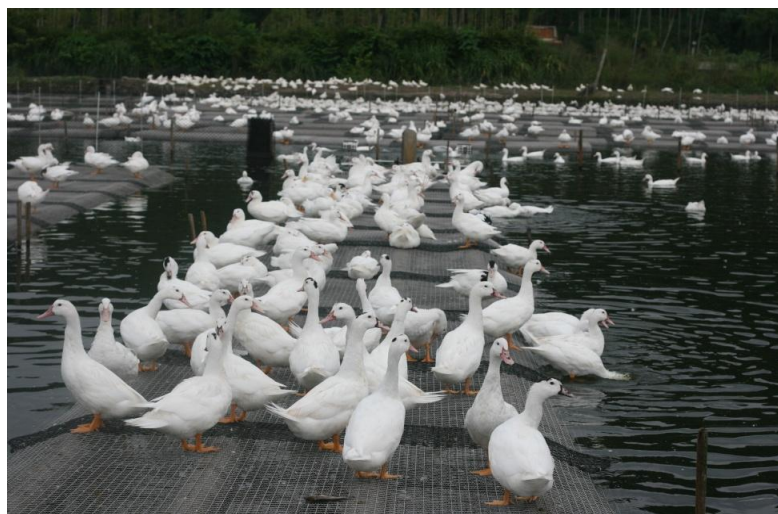
圖三、飼養於民間鴨場的五結白鴨後裔土番鴨。