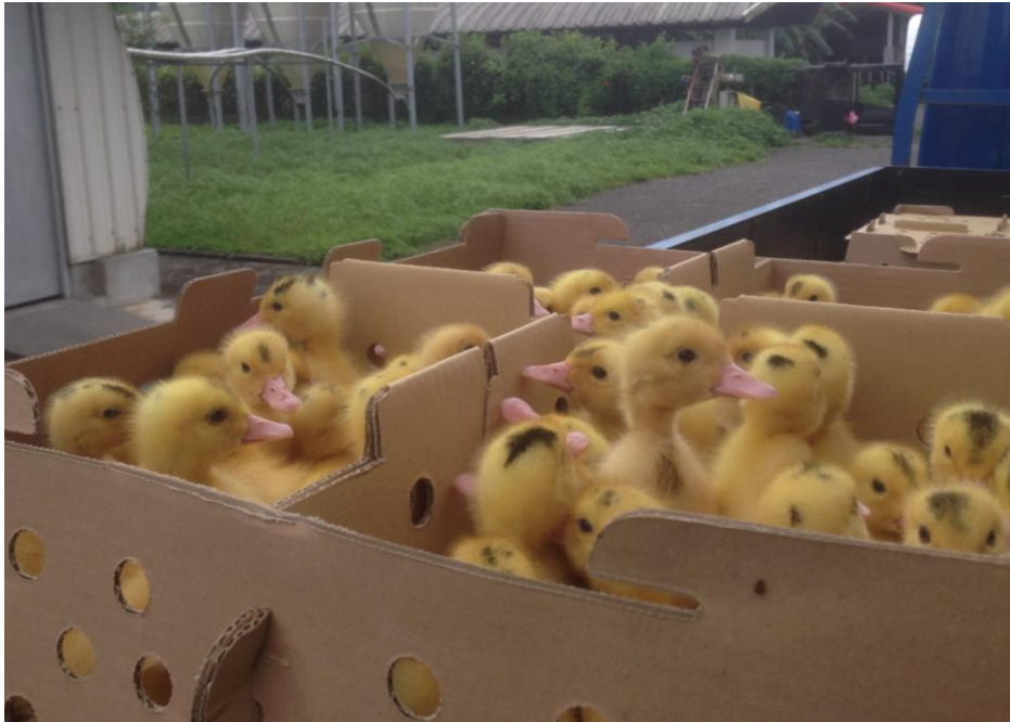
圖二、五結白鴨所生產之後裔土番鴨毛色等級平均為3級，大多為全白或僅頭部有黑色羽毛。