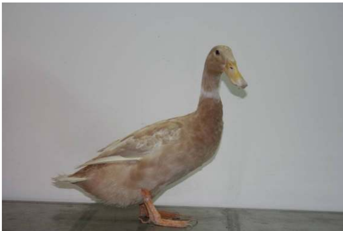
圖 1. 褐色菜鴨畜試三號種母鴨