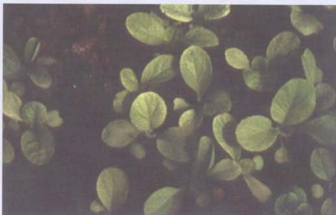
利用發芽試驗檢定堆肥腐熟度情形