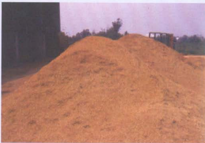
任何未遭受污染的有機物質均可作為製作堆肥的材料