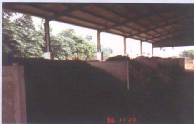
簡易堆肥舍(槽式)製作堆肥

天車式全自動發酵翻堆設施包括翻堆機、天車主體、天車軌道及PLC自動控制系統等,其主要特性(1)全自動控制免除人力監控(2)堆肥與空氣接觸均勻促進堆肥發酵(3)翻堆處理量大,每分鐘約2.5公尺長×1.8公尺寬×1.8公尺高(4)翻堆深度1.0-1.8公尺(5)每次翻堆堆肥前進距離約1.5公尺。另外設置送風處理以輔助天車式翻堆機空氣進入量之不足,並加速堆肥發酵後期水分之蒸散。