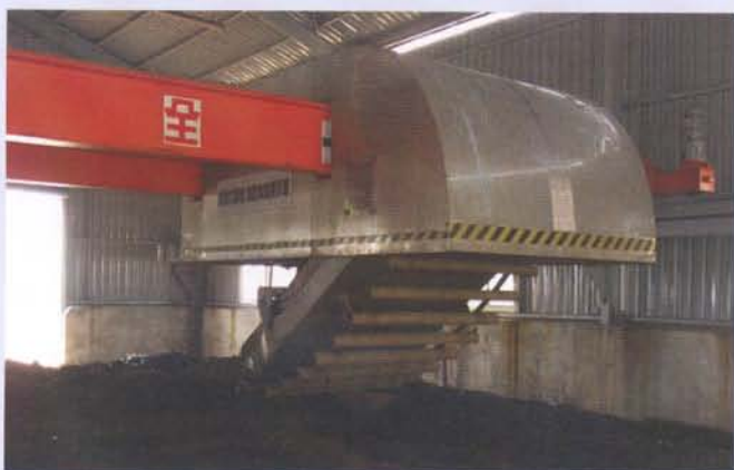
天車式自動化翻堆式製作堆肥