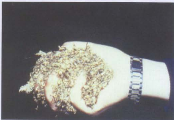
以手握緊方式測定堆肥材料水分含量