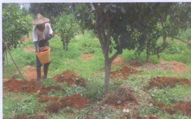
果園採用開溝覆土方式施用堆肥，可提高堆肥肥效

以上計算而得每公頃施用雞糞堆肥約7,700-9,300公斤。由於各種堆肥所使用之材料及混拌比例不同，其所含成分也各異，為使平衡養分的供應及防止土壤中重金屬的過量累積(特別是禽畜糞堆肥)，應選擇以不同材料製成的堆肥數種輪流施用。