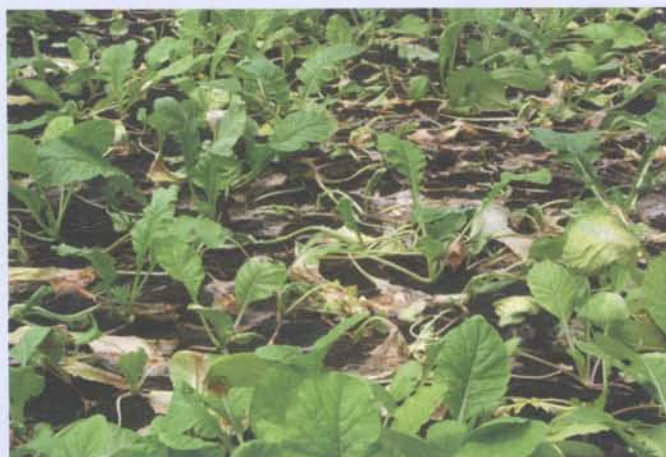
施用腐熟度不足的堆肥作物易遭雜菌感染

一般良好的堆肥其品質應符合下列各項要求：1.含有作物所需適量之營養元素(包括大量、次量及微量元素)。2.含有較高之有機質且穩定性高，植物殘體或泥炭有機質肥料較符合此一特性。3.無病原菌、蟲卵及雜草種子，堆肥體發酵時溫度達到60°C以上的高溫，可將其完全殺滅或致其無法發芽。4.腐熟度要高，施用未腐熟的堆肥，土壤水分適量時會進行二次發酵，產生高溫及有害物質，會影響作物根部的發育，同時產生臭味造成環境衛生的污染。5.不含有毒物質及過量的重金屬，依據肥料管理法肥料種類品目及規格一般堆肥(品目編號5-10)為例，規定砷(As)、汞(Hg)、鎘(Cd)、鉛(Pb)、銅(Cu)、鎳(Ni)、鉻(Cr)及鋅(Zn)含量，分別不得超過25 mg/kg、1.0 mg/kg、2.0 mg/kg、150 mg/kg、100 mg/kg、25 mg/kg、150 mg/kg及250 mg/kg。6.不易發生臭味。