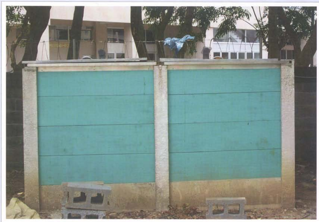
改良型通風式堆肥箱製作堆肥