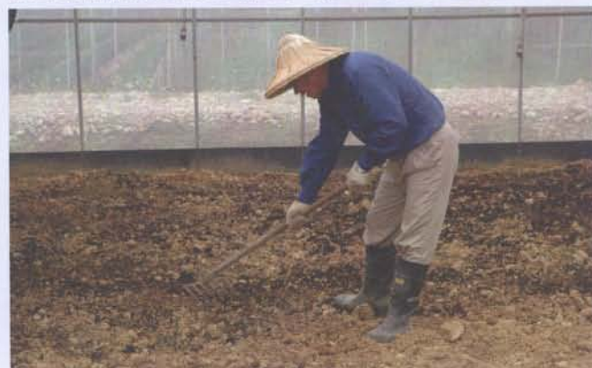
蔬菜、花卉等作物應於土壤翻耕前撒施，再進行翻耕混合，可提高堆肥肥效