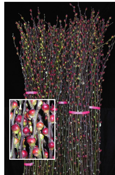
↑ 蘭陽一號採收處理後整把捆綁情形。

新品種銀柳「蘭陽一號」(貴妃)不同於中國上海種，其花苞由2至4個小花序構成一個近乎圓形的大粒花苞且芽鱗色澤鮮紅為其特色，其切枝之園藝性狀表現與中國上海種相當且瓶插壽命長，又較耐青枯病及其他蟲害，在目前農民大都栽培中國上海種的情形下，推出大粒花苞的銀柳新品種，以增加品種多樣化，供農民栽培及消費者購買時的新選擇。