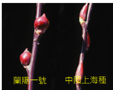
蘭陽一號 中國上海種