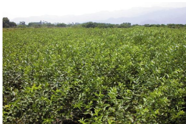
↑ 當第14葉展開時進行第一次摘心工作，以留5至6支枝條最佳。