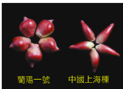
蘭陽一號 中國上海種