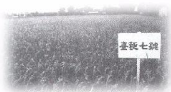
台梗七號成熟期間生育情形